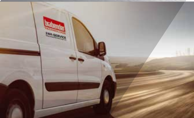
Unsere Techniker machen sich sofort auf den Weg zu Ihnen.