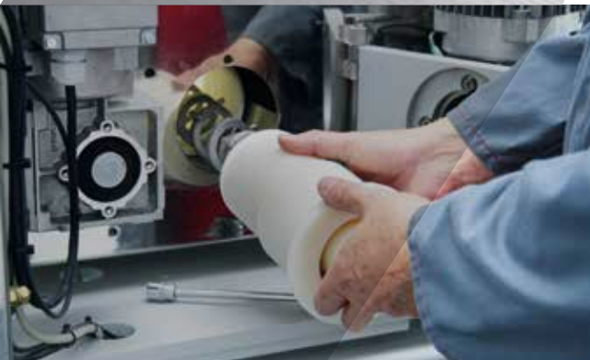
Austausch einer Schnecke