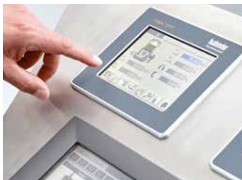
Einführung in die neue Mikrocomputersteuerung