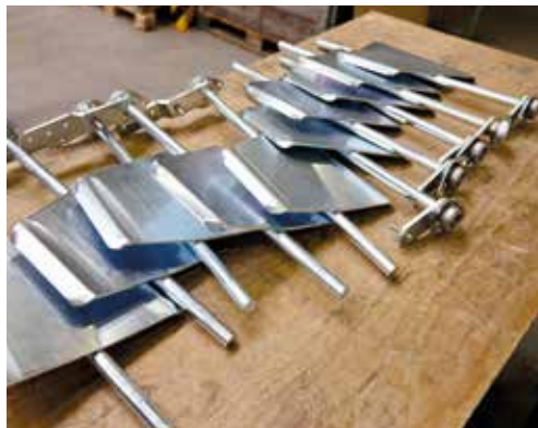
Immer das passende Ersatzteil