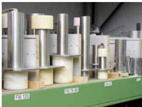
Schneckenrohre im Ersatzteillager