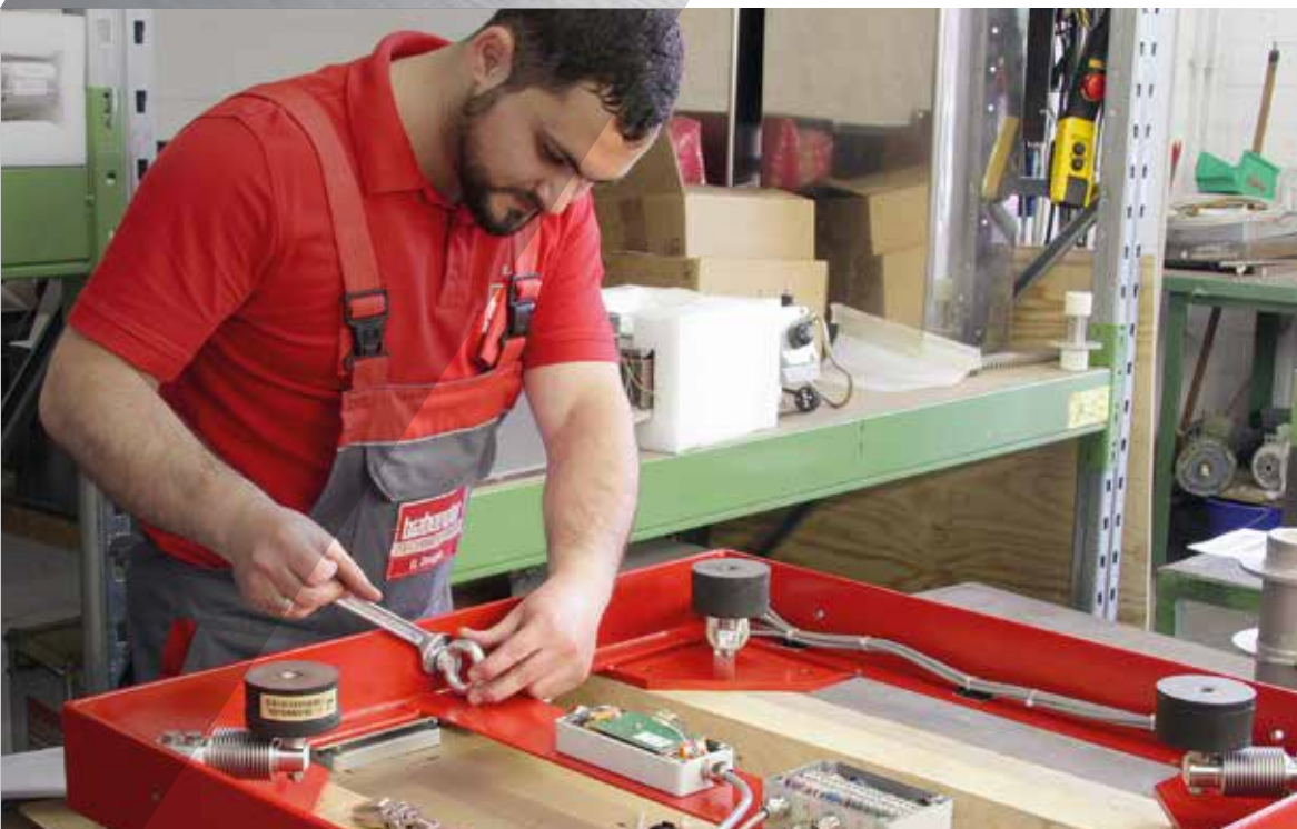
Umbau einer Wageplattform