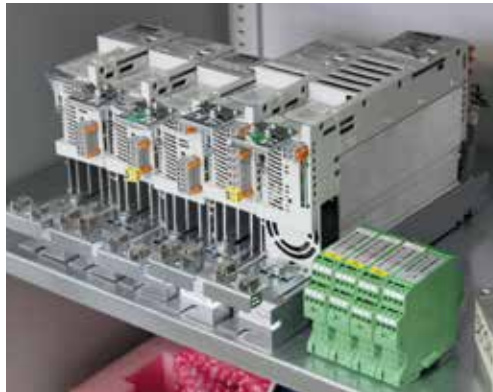
Elektronikbauteile auf Lager