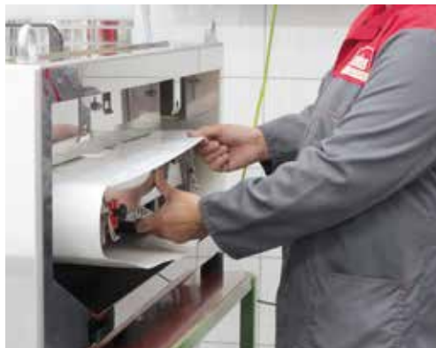
Reparatur einer Bandwaage