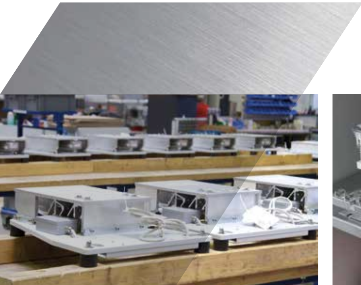
Wägezellen bereit zum Einsatz